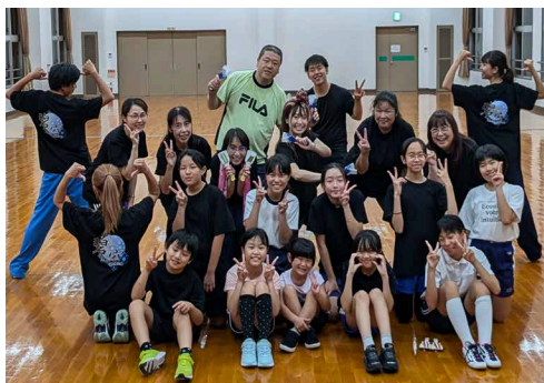
◀笑顔いっぱいのメンバー