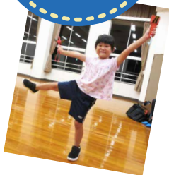
▲元気いっぱい踊る あいりちゃん