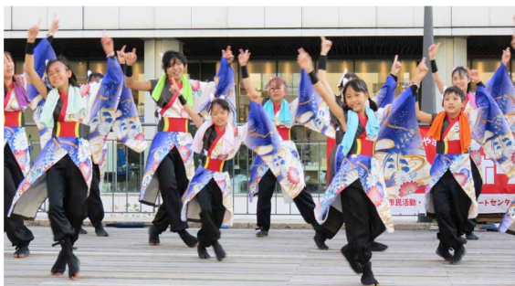
▲昨年の「ひめボラ市」でのステージ発表