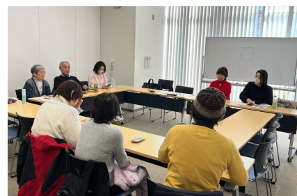
写真 サポーター勉強会の様子

ボイスオーバーの使い方を習得したサポーターが少ないのが実情です。デジタルデバイドの解消に一人でも多くの人に参加してもらうため、サポーター研修会を開催しています。