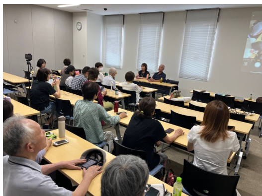
写真 スマホ講習会の様子

「文字を読む」「信号の色を知らせる」「周囲の情景を説明する」など、スマホは視覚障がい者の目の代わりをしてくれます。