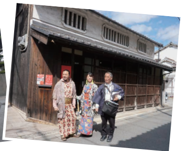
▲▶ 町家の見どころを説明しながらまち歩きをします