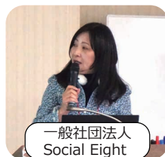
一般社団法人 Social Eight