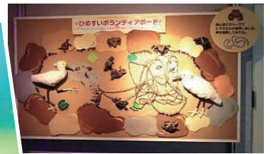
▲ボランティアさん 手づくりのボード