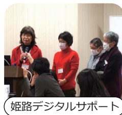
姫路デジタルサポート