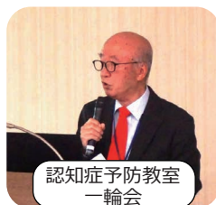
認知症予防教室 一輪会