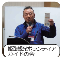
姫路観光ボランティア ガイドの会