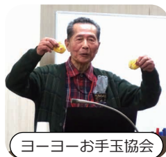
ヨーヨーお手玉協会