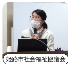
姫路市社会福祉協議会