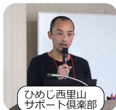
ひめじ西里山 サポート倶楽部