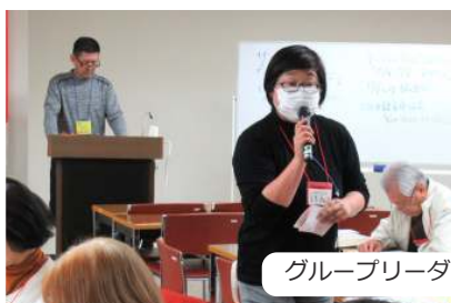
グループリーダーによる意見発表