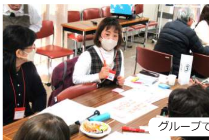
グループで意見交換