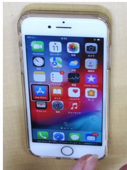
▲ボイスオーバーを使用できるように設定したiPhone