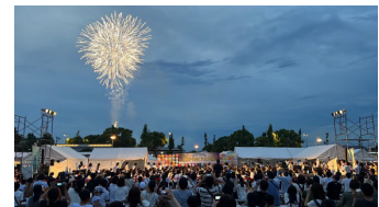
▲ピアノと花火の共演