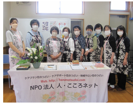
▲温かい笑顔で皆さんをお出迎え