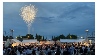
▲ピアノと花火の共演