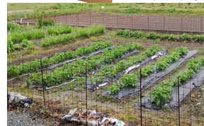
◀ボランティアの人たちと敷地内の畑で野菜作り。