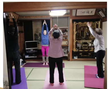
▲ソフトヨガでストレッチ。 ▶リラックスできるスペースもあります。