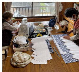
◀型紙を使ってケア帽子を作られています。