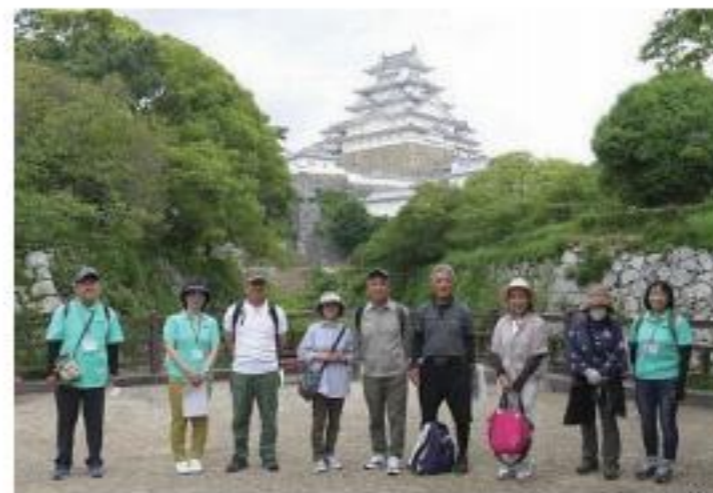
▲世界遺産姫路城を背に

【日時】 2023年5月13日（土） 9：30～12：30頃 【コース】 JR姫路駅⇒姫路城大手門⇒三の丸広場⇒姫路市立動物園⇒姫山公園⇒好古園前 【参加費】 500円（保険料、ガイド代） ※別途、動物園入園料（210円）は自己負担 ※姫路城には入城しません 【歩程】 約5km ※当日6：00、姫路地域に気象警報が発表されている場合は中止