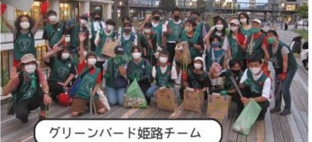
グリーンバード姫路チーム