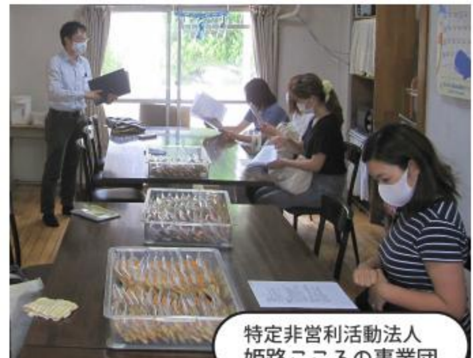
特定非営利活動法人 姫路こころの事業団

幼い子どもたちと触れ合うことで、昔の自分を思い出したり、どうしたらうまく伝わるかを思考して、話すことができた。 (木工工作などの補助体験)