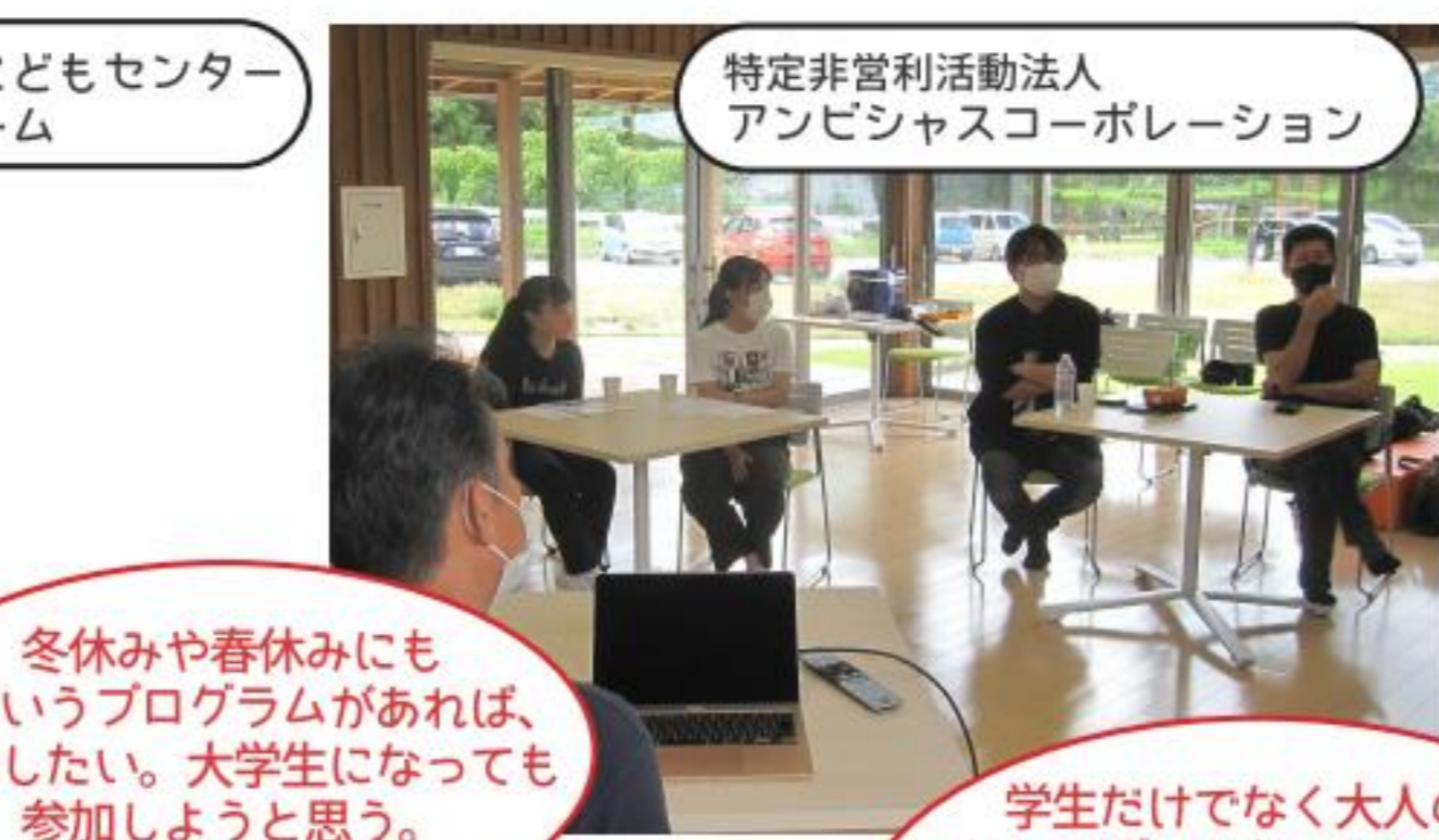
特定非営利活動法人 アンビシャスコーポレーション

子供たちを支える活動をする気持ちでしたが、実際は私の方が楽しませてもらい、学ばせてもらいました。この活動でボランティアに対する考えが変わり、将来の選択肢の範囲が広がりました。 (療育体験)