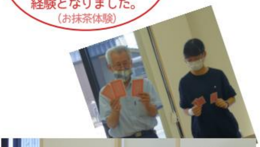
「手品文化講座」 受講生ボランティア

ボランティアの方々の活動がなければ、ある程度清潔な町は維持できないことがわかりました。見えないところで活動している方々の存在を忘れないようにしたいです。 (清掃体験)