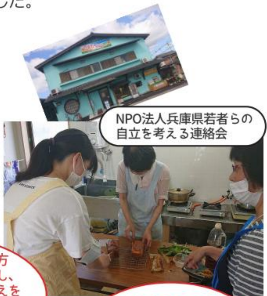
NPO法人兵庫県若者らの自立を考える連絡会

学生だけでなく大人の方たちとディスカッションし、いろんな人の価値観や考えを知ることができ、とても面白く勉強になりました。 (NPO法人勉強会体験)