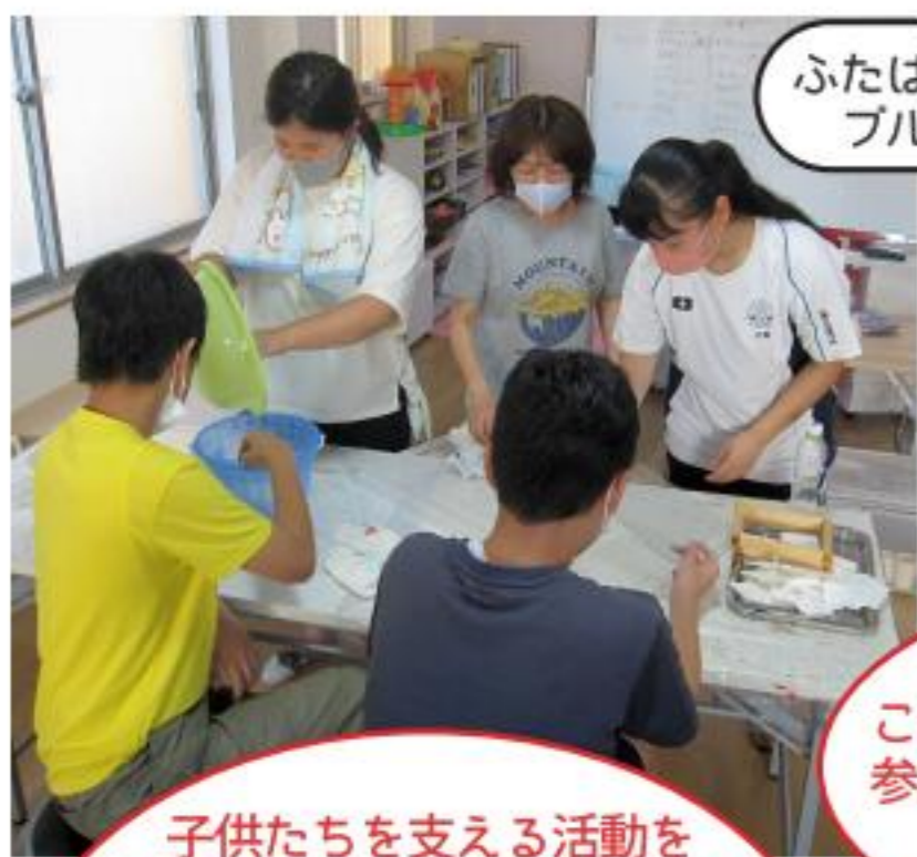
ふたばこどもセンター ブルーム

学生の皆さんに、夏休みを利用してボランティア活動を体験していただく、第4回『ひめじ夏のボランティア体験』を8月に実施しました。コロナ禍にも関わらず、19の受け入れ団体・施設にエントリーいただきました。また、学生の皆さんも75名の申込みをいただき、いずれも過去最高の結果となりました。その活動風景の一部を、参加者の皆さんの感想とともにご紹介します。