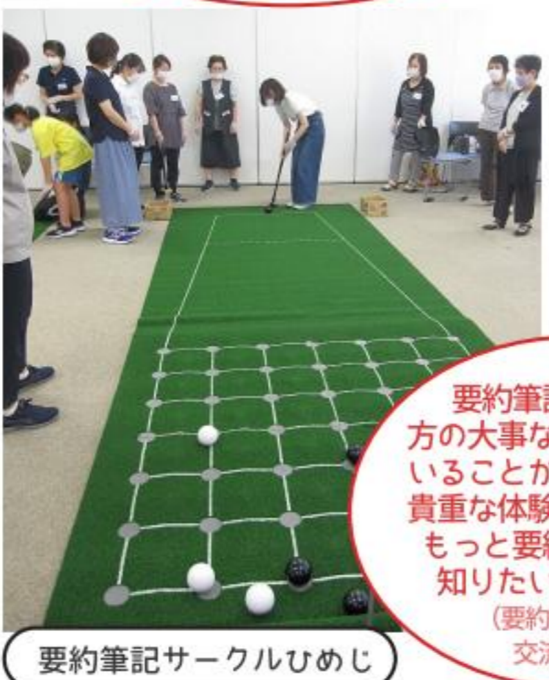
要約筆記サークルひめじ

要約筆記が難聴者の方の大事な情報源になっていることがよく理解でき、貴重な体験になりました。もっと要約筆記について知りたいと思います。 (要約筆記・難聴者交流会体験)