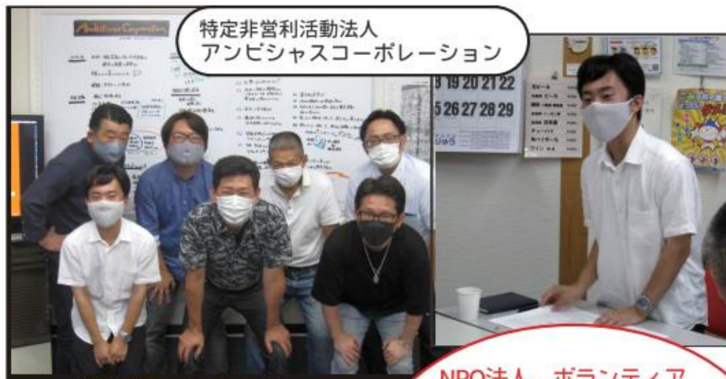
特定非営利活動法人 アンビシャスコーポレーション

NPO法人、ボランティアなどの非営利団体について、その在り方や活動の基軸などを学ぶことができました。活動の意図・目的を理解して参加できるようになりましたと思います (NPO法人勉強会体験)