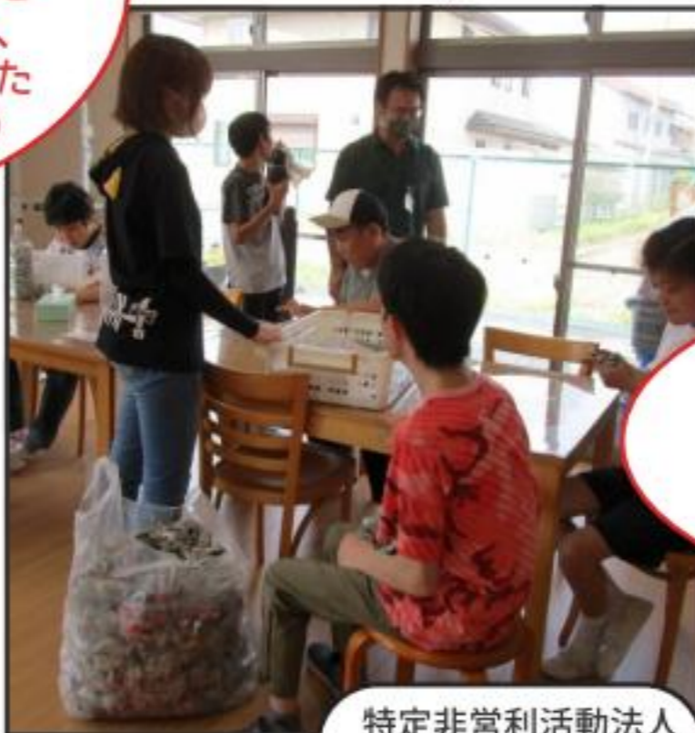
特定非営利活動法人 香里菜福祉会

1日だけでなく、もう少し長い期間活動できればよかったと思いました。職業体験のように、面白さを実感できました (障がい者支援事業所体験)