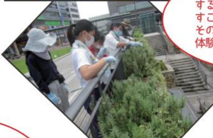
姫路市まちづくり振興機構 緑化推進部

自分たちの住む町をキレイにすることは大きな達成感があり、すごく心地よくなりました。その後もこの場所を見るたび、体験の思い出が頭に浮かびます (緑化ボランティア体験)