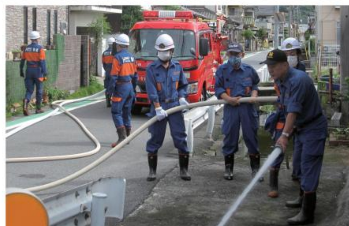
▲この日は防火用井戸からの放水訓練

▼火災時に備え、防火用井戸は定期的に放水して水が出るかを確認する必要があるとのこと