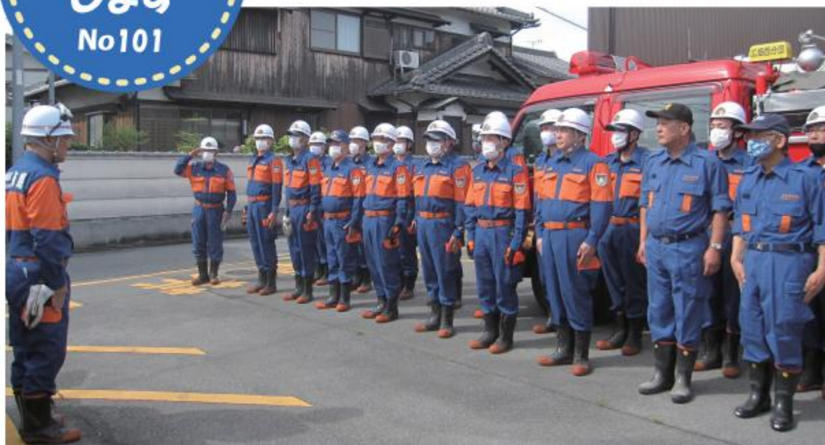
▲毎月第2日曜日に実施される演習にて。右端がタスケンジャーのお二人