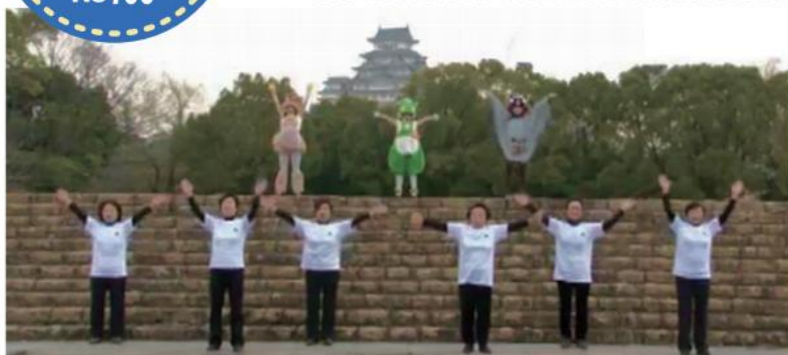
▼「生涯現役フェスティバル」で、来場者の皆さんと一緒に体操を