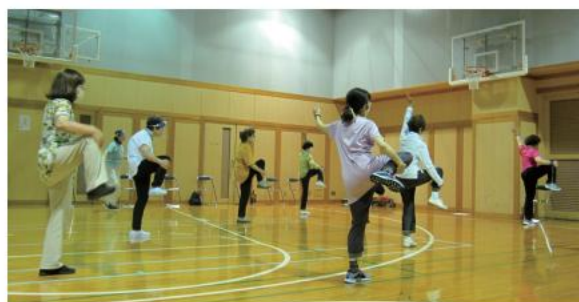
▲▼イーグレひめじでの教室風景。7月現在は、新型コロナウイルス対策として定員を減らして実施しています

「毎回、ゲスト講師によるヨガや太極拳などのサプライズのプログラムを用意して、体操と合わせて楽しく体験