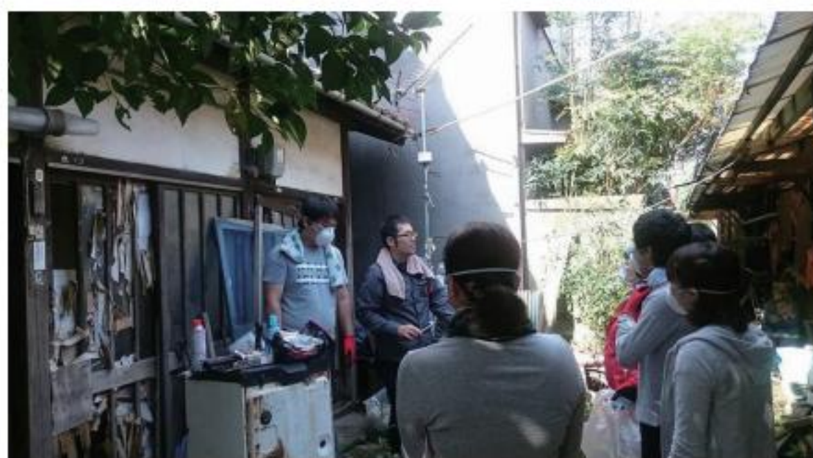
▲専門職からの相談を受け、他活動を行っています