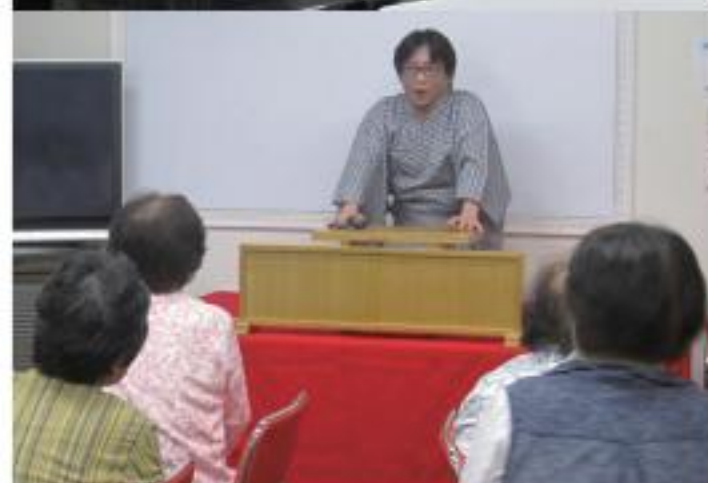
▲認知症予防サロン「いごこちサロン」は、NPO法人アンビシャスコーポレーションと共同で、毎月第3日曜日の10：00～12：00に開催